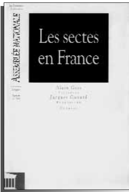
Planche 1 : Le rapport parlementaire liste comme “sectes” de nombreux groupes chrétiens dont un séminaire baptiste. Aucun groupe islamiste n’est mentionné.