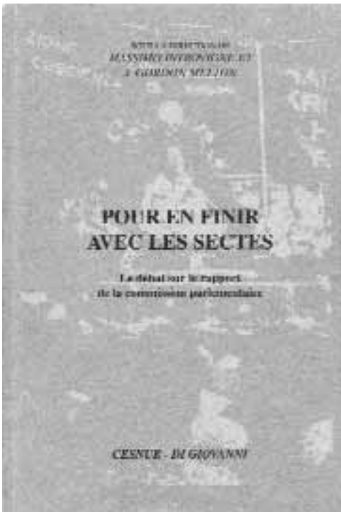
Planche 8 : Dans cet ouvrage collectif publié en juin 1996 peu après la parution du rapport parlementaire, plusieurs universitaires réputés s'expriment sur le rapport qu'ils jugent trop entaché d'erreurs de fait, de jugements sommaires et de lieux communs tirés d'une "littérature non scientifique".