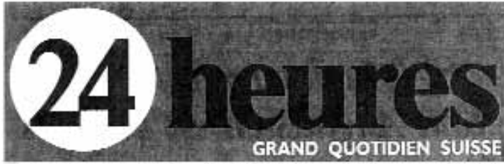
Planche 9 : Le directeur du Centre d'études sur les nouvelles religions (Cesnur) s'est exprimé à plusieurs reprises dans la presse pour critiquer vivement le rapport parlementaire.

Mardi 22 avril 1997 - N° 92 - Frs. 1,70 (TVA 7% incluse) - FF. 6,80 - 66 ****